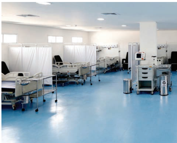
Equipamento terá 95 leitos de internação