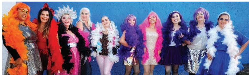
Grupo do RPFC se apresentará nos dias 25 e 26/10

Pela primeira vez fora do Brasil, o grupo está ensaiando três vezes por semana e buscando apoio da iniciativa privada para concluir o sonho da via-