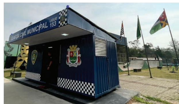
Base fica nas dependências do CEU Ouro Fino