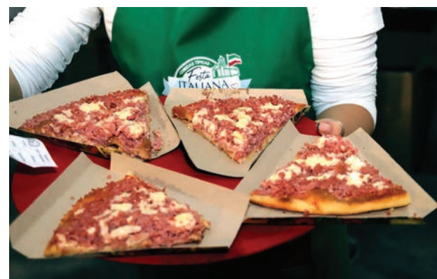
Evento será realizado no Complexo Ayrton Senna