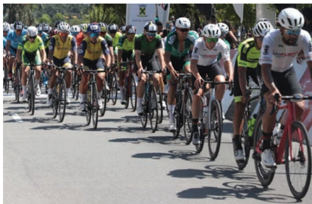
Competição passa pelas 7 cidades da região

A prova contará pontos para o Ranking Paulista de Estrada, na Classe CBC, e para o Ranking Nacional (CBC),