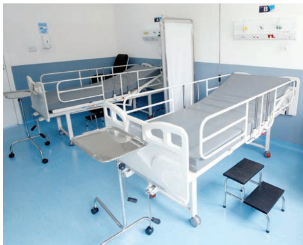
Hospital conta com equipamentos de ponta