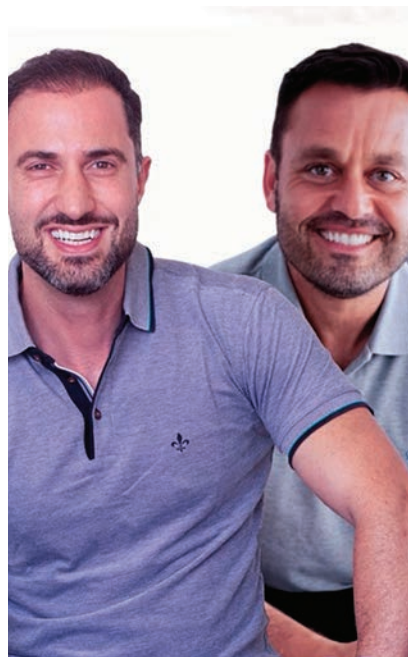
Evento será no Salão Social do RPFC