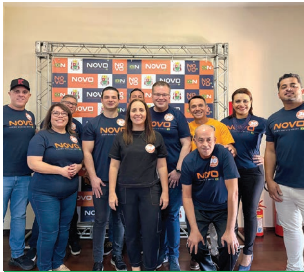
Evento será no Buffet É o Casco