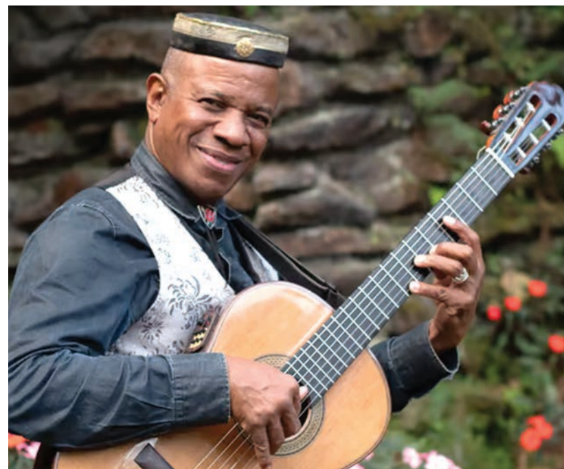
O violonista Robson Miguel, radicado em Ribeirão Pires

O show no Mirante São José será uma oportunidade única para o público de Ribeirão Pires vivenciar a genialidade de Robson Miguel, um artista que transcende fronteiras com sua arte. A apresentação promete ser uma celebração da música em suas mais diversas formas, evidenciando o talento e a paixão de um dos maiores nomes do violão mundial.