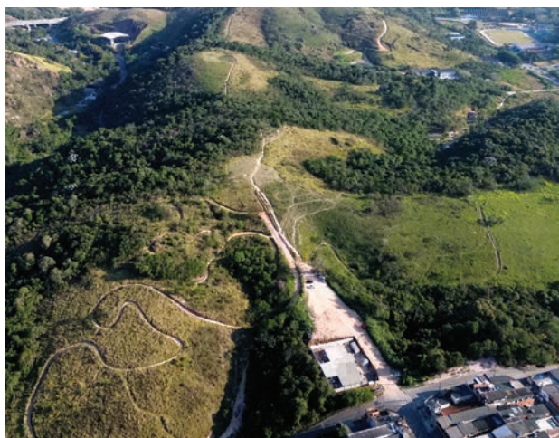
Empreendimento popular será no Jardim Serrano

Cada unidade habitacional terá sala, cozinha, banheiro, área de serviço e dois quartos. Serão erigidos no espaço aprovado quatro edifícios de cinco andares. O projeto prevê área comum, esta-