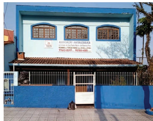
Sede do AA fica no Jardim Itacolomy