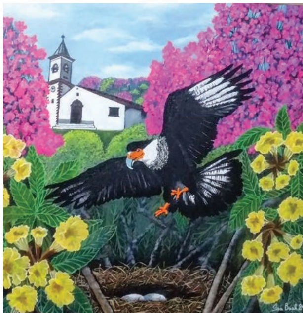
Artista irá expor 2 obras homenageando Ribeirão Pires