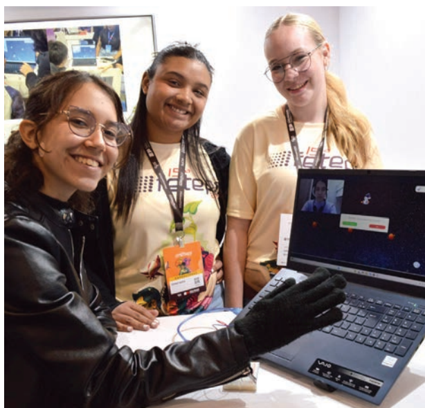
Alunas apresentam jogo controlado por movimento ocular

“Foi a partir desse relato, da mãe com a nossa orientadora que passamos a buscar al-