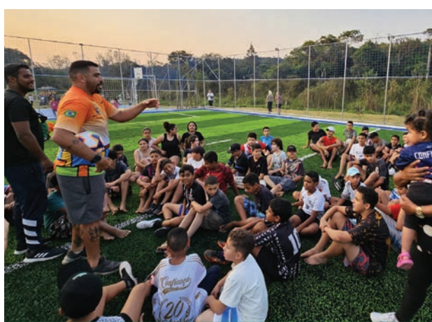
Equipamento foi entregue na última quarta-feira