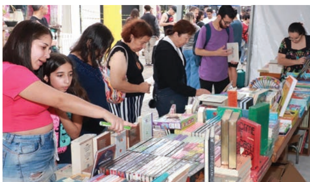
FLIRP irá homenagear Ariano Suassuna

Durante os dois dias de evento, o visitante também terá contato com exposição feita com trabalhos elaborados por estudantes da rede municipal e também por professores que participaram de oficinas ao longo do ano. Obras com técnicas de xilogravura, literatura de cordel e desenhos baseados em arte armorial formam a