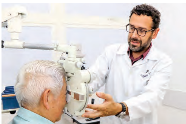
Oftalmologia é uma das especialidades atendidas

Neste mês de aniversário de 2 anos do CEM/