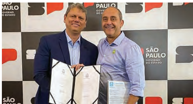
O governador Tarcísio de Freitas e o prefeito Guto Volpi

Partindo do Paço Municipal de Ribeirão Pires, na região central da cidade, o acesso mais próximo ao anel viário es-