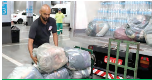
Donativos foram entregues no RS na última quarta-feira

As doações entregues ao Fundo Social passaram por triagem, sendo devidamente separadas em sacos com peças masculinas, femininas, infantis e sapatos; afim de facilitar o trabalho dos voluntários que receberão as peças no Rio Grande do Sul. A mobilização continua e as doações poderão ser entregues hoje (10) de