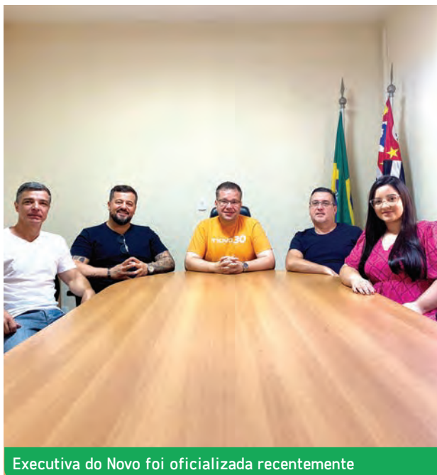
Executiva do Novo foi oficializada recentemente