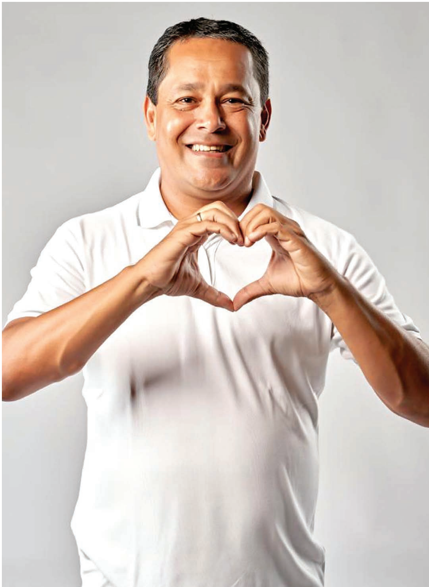
Professor PC garantiu mais um investimento na Saúde de Ribeirão Pires

O câncer de mama se configura como a principal causa de morte por câncer entre as mulheres brasileiras, com mais de 17 mil óbitos anuais. As regiões Sul e Sudeste concentram os maiores índices de mortalidade pela doença. Apesar do cenário preocupante, a detecção precoce é crucial para o sucesso do tratamento. O autoexame das mamas e a mamografia a partir dos 40 anos são medidas essenciais. É importante ressaltar que o câncer de mama não representa uma sentença de morte. Com diagnóstico e tratamento adequados, muitas mulheres podem superar essa doença e viver uma vida plena.