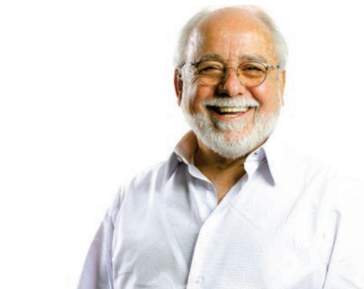
Clóvis Volpi, prefeito de Ribeirão Pires

CV: Tem duas alternativas: a primeira é o país voltar a crescer. Se isso acontecer, resolvemos o problema mais rapidamente. Como a perspectiva é de que este país não vá crescer economicamente nos próximos três ou quatro anos, vai engatinhar para poder crescer depois, só tem uma saída: cortar despesas. Não tem truque e nem milagre. Mas, quando você faz isso, sacrifica serviços públicos como Educação, Saúde, Manutenção da Cidade, Cultura, Esporte. Uma cida-