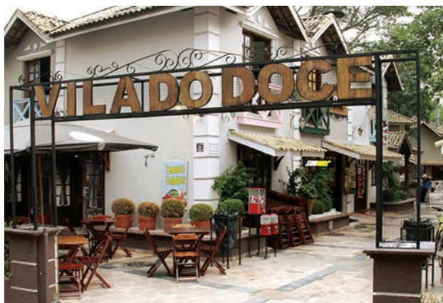
Ruas podem ficar vazias para frear o vírus

Os prefeitos do Grande ABC pediram ao governo do Estado a decretação de um lockdown em toda a Região Metropolitana de São Paulo. O pleito foi deliberado nesta quinta-feira (18/3), em assembleia ex-