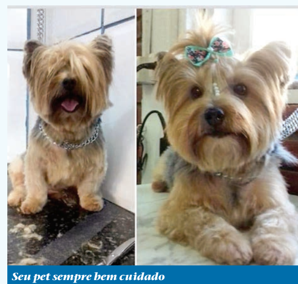
Seu pet sempre bem cuidado

Com promoções diferentes todos os meses, os seguidores do Instagram estão sempre por dentro das novidades. No ano passado houve o CatDay que já tem data prevista para abril junto com uma Promoção para Coelho e pequenos roedores em breve. Houve também promoção para o saudoso "Vira Lata" nacional, considerado SRD (sem raça definida) médio com pelagem curta, com recorde de curtidas nas publicações do Instagram. Agora em MARÇO é a vez da PROMOÇÃO