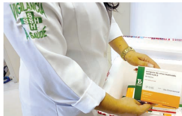
Novo lote de vacinas chegou na manhã de ontem

Na segunda-feira, dia 22, o município inicia a imunização dos idosos 72+. Para a vacinação é necessário apresentar CPF e comprovante de residência. A imunização ocorre via Drive Thru no complexo Ayrton Senna (Av. Prefeito Valdério Prisco, 193), das 8h às 16h.