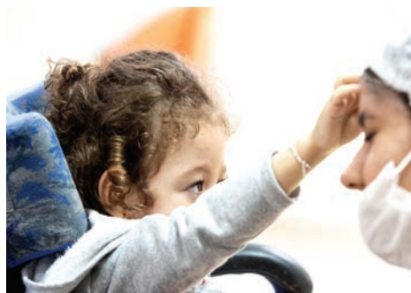
Centenas de pessoas são atendidas...

Com aporte do SUS, contempla os pacientes das sete cidades da região com órteses, próteses e cadeiras de rodas, inclusive motorizadas. A APRAESPI é referência do Ministério da Saúde em reabilitação, auditiva, visual, intelectual e física e é considerada pelo órgão como um modelo de eficiência e gestão.