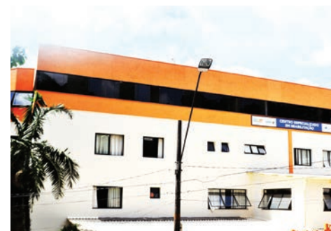
... todos os dias no Hospital-Dia