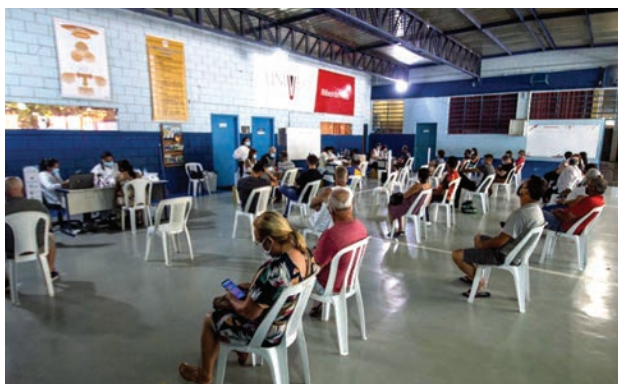
Testagem atende cerca de 250 pessoas por dia

Reforço na testagem de covid-19 - A Secretaria de Saúde de Ribeirão Pires recebeu neste mês a doação de testes do Instituto Butantan. Além dos kits para testagem, o municí-