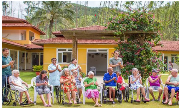
Ideia é prover espaço qualificado de convivência

Siga as redes sociais: facebook.com/leo.costa.prtb e instagram.com/leocosta-prtb