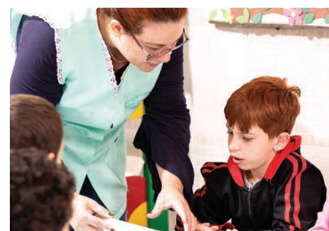
Equipe educacional é qualificada